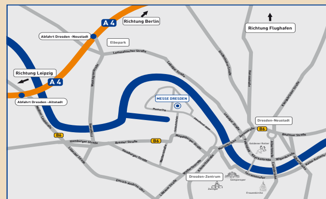
MESSE DRESDEN | Anfahrtsskizze Auto

MESSE DRESDEN GmbH | Messering 6, 01067 Dresden